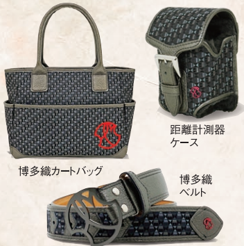
博多織カートバッグ