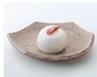
たねや饅頭さくら

創業明治5年、近江の老舗和菓子舗<たねや>。お菓子の素材は自然の恵み。季節や行事も和菓子を支える大切なものと考え、折々の素材を活かしたお菓子づくりを続けています。豊かな風土と歴史が織りなす季節の移ろい。めぐる季節のお菓子に美しい風情を添えて、ふるさと近江八幡からお届けします。