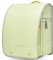
レモン・アイボリー