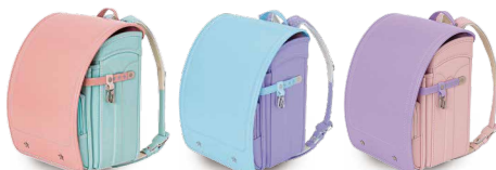
ピーチ× ミントグリーン