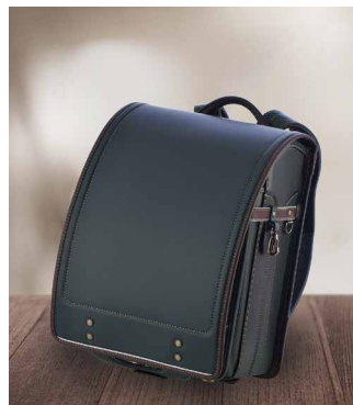
グリーン×ブラウン