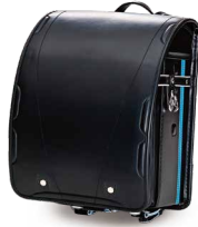
T5ドクターイエロー 「JR西日本商品化許諾済」

新幹線の各車両をモチーフにしたランドセル。ステッチラインやかぶせ裏など細部まで遊び心たくさんのデザインです。