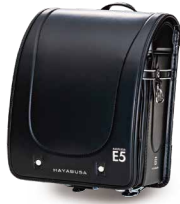
E5系はやぶさ 「JR東日本商品化許諾済」