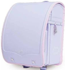
ライトパープル・ベビー