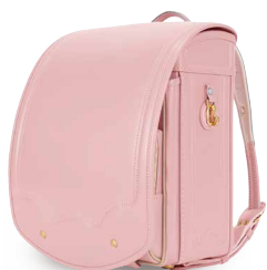
パウダーピンク×ペーじュ