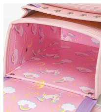
ライラック× パウダーピンク