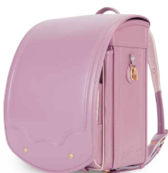
ラベンダーローズ×ペーじュ

手紙や思い出が詰まったダイアリーを表現したデザイン。繊細なお花柄の素押しなどシンプルでありながら上品なデザインです。