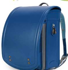
ディーマリン×チャコールグレー