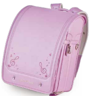
クラシカルパープル

鍵盤型のフロントポケットやかぶせ部分の音符鉾、サイドにも音符やト音記号をあしらったピアノをモチーフにしたランドセルです。