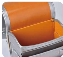
キャメル無地内装