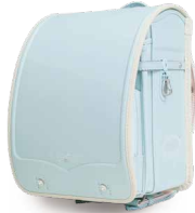
ミント・アイボリー

お花のかんむりをイメージした刺しゅうのランドセル。刺しゅうはシンプルに、単色の糸で上品に仕上げました。