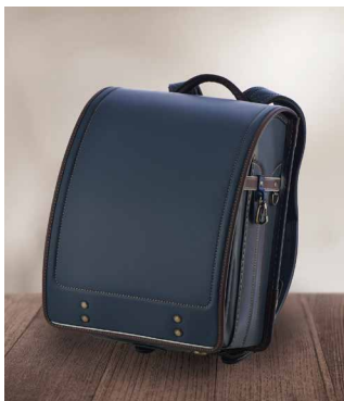
ネイビー×ブラウン