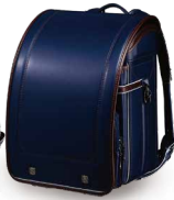
ネイビー×ブラウン

大マチ13.5cmの大容量ランドセル。本体素材には傷がつきにくいクラリーノ「タフロック ® NEO」を使用しています。