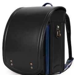
ブラック×マリンブルー