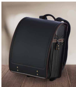
ブラック×ブラウン