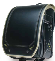
ブラック×ゴールド