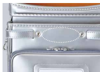
点線部に入ります。