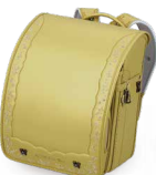
リーブルゴールド