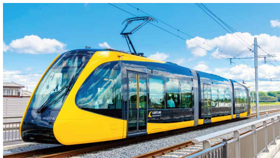
宇都宮ライトレール線 通称「ライトライン」

栃木県の工場で職人の熟練の技で手作りしているオオバランドセル。 創業90周年を迎え、宇都宮市を走るライトラインとのコラボモデルが登場。 次世代路面電車として2023年開業以来、全国の鉄道ファンや観光客で賑わい、 開業1年強で600万人を集客し人気を博しています。 車体をイメージしたイエロー×ブラックの配色がかっこいい限定モデルは、 90周年を記念して全国で90個限定生産。通常直営店でしかお取扱いのない 限定モデルを、今回同じく創業90周年を迎える井筒屋に特別出品いたします。