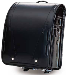
N700系さくら・みずほ 「JR西日本商品化許諾済 / JR九州承認済」