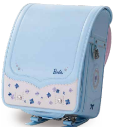
サクセス×アイボリー