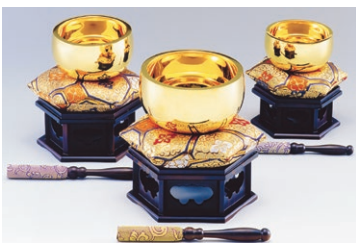
K18 おりん 光則 作

金相場の高騰でますます金に注目が集まるなか、本年も「おりん」をはじめとする仏具、人気の高まる「小判」を中心に、美術工芸品や縁起物の置物、根付などの小物まで幅広く取揃え展示・販売いたします。