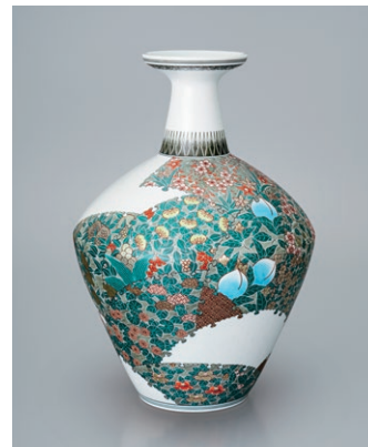
色絵雪花墨色墨はじき四季花文花瓶 (径34.0×高48.0cm)…………… 5,500,000円