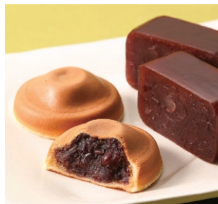
<阿闍梨餅本舗 満月> 阿闍梨餅-京納言