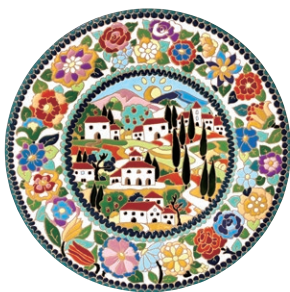
<ポツェガ・エッセ> リリエーボ陶器 大絵皿(直径45cm)

パスタにピッツァ、ジェラートに生ハムなど世界中にその食文化が広がったグルメの数々。ファッションやアクセサリ、革製品にベネチアンガラスなど技術水準の高い伝統工芸。今回はイタリアンの巨匠<リストランテ アルポルト>(東京・西麻布)の至福の美食をイトインでお楽しみいただけます。「太陽の笑顔がこぼれる国」イタリアの魅力を存分にご堪能ください。