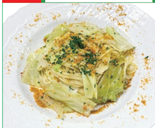
<リストランテ アルポルト> キャバツとカラスミのピアンコ スパゲッティ