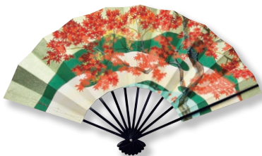
<京扇堂> 飾り扇子(表面:紅葉/裏面:桜)

長年お客様に親しまれ続け、第46回を迎える「大京都展」。歴史と伝統を守りながらも時代に寄り添い、その魅力を発信し続ける京都。老舗の味と職人の技の数々に加え、未来につなぐ、新しい京都の感銘をお届けいたします。