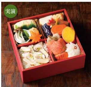
<美濃吉> 井筒屋限定品 京の味わい(松茸ご飯)