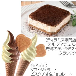
<ティラミス専門店 デル・ティラミス> 奇跡のティラミス クラシック