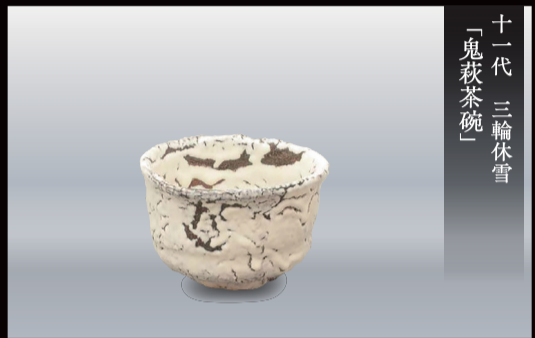
十一代 三輪休雪 「鬼萩茶碗」