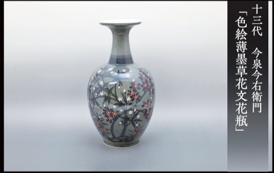
十三代 今泉今右衛門 「色絵薄墨草花文花瓶」