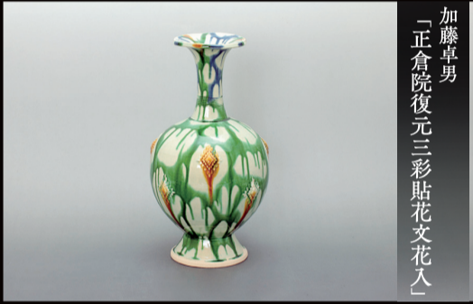
加藤卓男 「正倉院復元三彩貼花文花入」