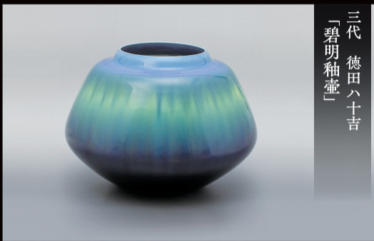
三代 徳田八十吉 「碧明釉壺」