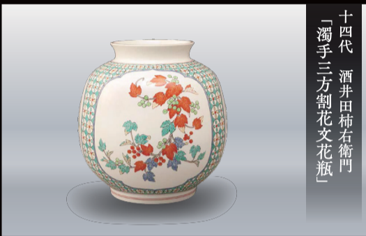
十四代 酒井田柿右衛門 「濁手三方割花文花瓶」