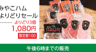
みやこハム よりどりセール ... よりどり3個 1,080円 限定数100