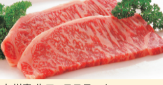
九州産 牛ロースステーキ (1パック、約160g×2枚) 2,500円 限定数60 ※お一人様2パック限り。