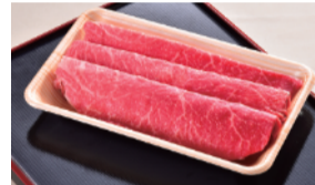
小倉牛ももスライスすき焼用 (1パック、約150g) ... 1,080円 限定数50