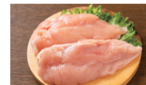
国産 鶏むね肉 (100g) ..... 100円 限定24kg