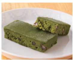
宇治抹茶のしっとりとした濃厚なケーキ。小豆の食感がアクセントです。 〈京菓子 笹屋伊織〉 JAPANESE REDBEAN CAKE (抹茶) (1個) ..... 324円