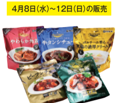
4月8日(水)~12日(日)の販売 〈伊藤ハム〉 クイックディナー各種 (1パック) ..... 980円 限定数各40