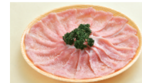
霧島ポーク 豚ロースしゃぶしゃぶ用 (1パック、約180g) ..... 500円 限定数100