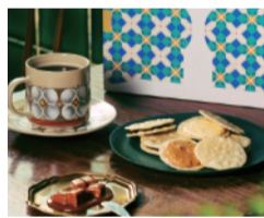
〈トーキョー煎餅〉 ●4月8日(水)~14日(火) ●スイーツキッチン 懐かしくて新しい、米菓のおいしさの新境地。3種類のおいしさを味わえる詰合せです。 煎餅サンド詰合せ (12個入) ..... 3,024円