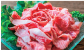
小倉牛切落し (1パック、約150g) ... 1,080円 限定数50