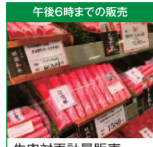
午後6時までの販売 牛肉対面計量販売 平常価格の 3割引 豚肉対面計量販売 ... 平常価格の 2割引