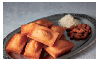
〈Kelly(ケリー)〉 ●4月8日(水)~21日(火) 全国初「焼きたてフィナンシェ」が期間限定で登場。表面はカリッ、中はふんわりとした食感。こだわり素材のフィナンシェを焼きたてでご提供いたします。 焼きたてフィナンシェ (1個) ..... 238円