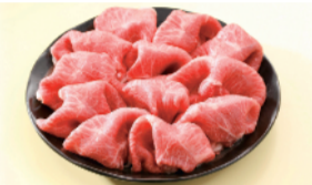
九州産 黒毛和牛霜降り肩切落し (解凍品、100g) ..... 598円 限定40kg