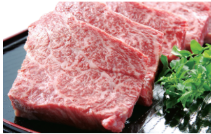
北九州名産 小倉牛ももステーキ (1パック、約150g) ..... 1,080円 限定数100