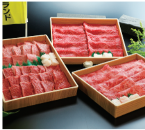
北九州名産 小倉牛フェア 1頭分売りつくし均一セール (1パック) ..... 1,080円