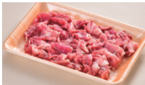
鹿児島県産 黒豚切落し (1パック、約250g) ..... 480円 限定数100