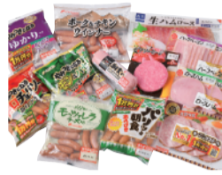
フードリエ ハム・ウインナー各種 よりどりセール ... よりどり5個 1,080円 限定数300 ※お一人様3セット限り。