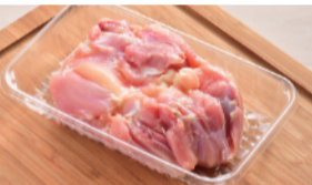
国産 鶏もも肉 (100g) ..... 100円 限定24kg