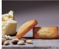
予告 〈アンリ・シャルパンティエ〉 ●4月15日(水)~21日(火) ●エレベーター前 特設会場 1975年の誕生以来、素材と製法にこだわり続け、真似のできないおいしさを求めて進化してきました。 フィナンシェ (3個入) ..... 540円