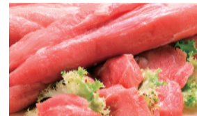
霧島ポーク 豚ヒレブロック (1本) ..... 880円 限定数50