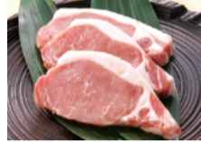
霧島ポーク 豚ロース とんかつ用 (5枚) ... 980円 限定数100