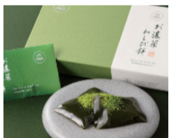
抹茶の風味や色合いを生かしながらじっくり練り上げたわらび餅です。 〈葉匠 清閑院〉 お濃茶わらび餅 (3個入) ..... 918円