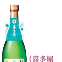
〈喜多屋(福岡県)〉 ●4月8日(水)~14日(火) ●和洋酒 文政3年創業。地元八女市の水と米にこだわり、伝統と革新で磨かれた上質な味わいの日本酒をご紹介します。 純米酒 喜多屋 夏酒(720ml) ..... 1,628円 限定数30