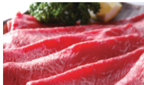
九州産 黒毛和牛肩ロース スライス ... 平常価格の 半額 限定30kg ※お一人様1kg限り。