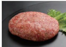
北九州名産 小倉牛ハンバーグ ステーキ (1枚、約180g) ... 880円 限定数50