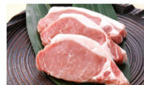
霧島ポーク 豚ロースとんかつ用 (4枚) ..... 980円 限定数100