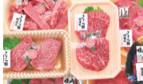
九州産 和牛 霜降り肩すき焼用 (解凍品、100g) 598円 限定40kg