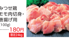
みつせ鶏 もも肉切身・ 唐揚げ用 (100g) ..... 180円 限定24kg