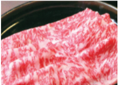
九州産 黒毛和牛肩スライス 鉄板焼用(1パック、約150g) ..... 1,080円 限定数100