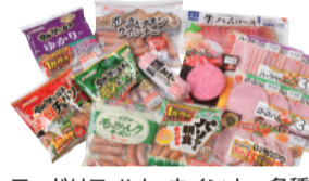
フードリエ ハム・ウインナー各種 よりどりセール ... よりどり4個 1,080円 限定数100