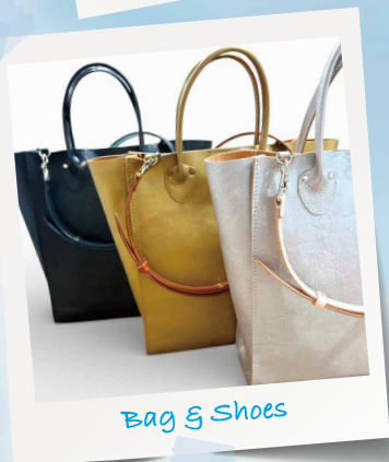
Bag & Shoes