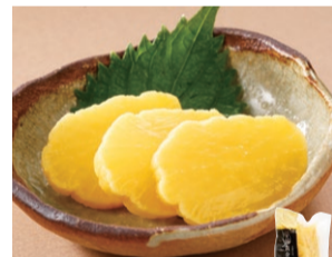
〈京つけもの大安〉 黄金沢庵 (1本) ..... 702円