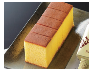
〈異人堂〉 長崎カステラ ゴールド ミニ (5切) ..... 648円