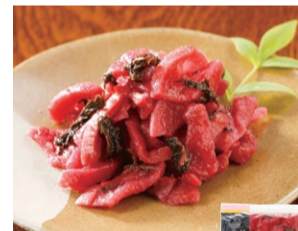
〈京つけもの大安〉 梅だいこん (138g) ..... 540円