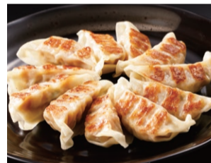
〈長崎中華本舗〉 スイートコーン餃子 (冷凍、12個) ..... 432円