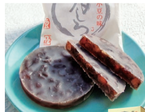
〈豆政〉 月しろ (5枚入) ..... 756円