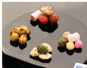
〈豆政〉 京ごのみ 豆づくし (4種入) ..... 972円