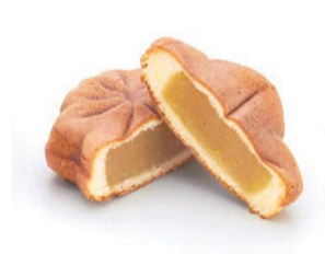
〈にしき堂〉 お芋もみじ (1個) ..... 131円