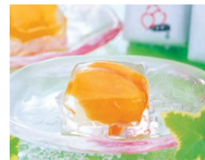
〈茂木一〇香本家〉 茂木ピワゼリー (3個入) ..... 1,134円