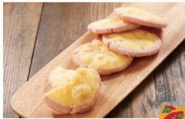
〈満果惣〉 季節の米菓 さつまいも (8枚入) ..... 864円