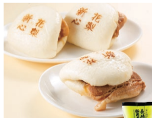
〈長崎中華本舗〉 長崎豚角煮饅頭 (冷凍、3個入) ..... 1,188円