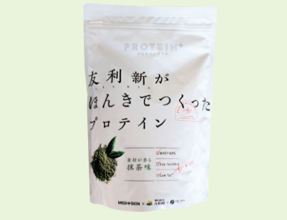
ほんとうに必要なモノを、必要な量だけ。その数にこだわりました。健康な身体を維持するのに欠かせない栄養素「たんぱく質」。1日の食事では補うことの難しい「たんぱく質」を必要分だけ補う習慣を身につけましょう。1日27gで約16gのたんぱく質が摂れる! 友利新がほんきでつくったプロテイン ほうじ茶ラテ味・抹茶味 (各351g) 各2,463円