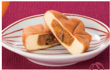
〈にしき堂〉かぼちゃもみじ (5個入) ..... 801円 (1個) ..... 151円