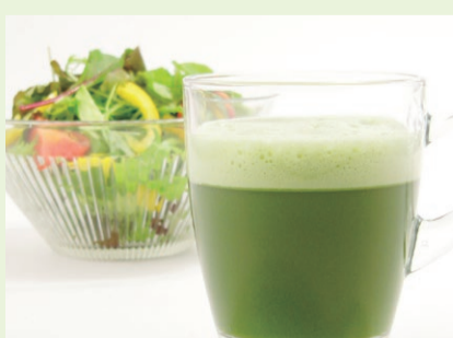
有機大麦若葉エキスの青汁 (3g×30包) (1袋) ..... 3,564円 (5袋) ..... 30包増量 17,820円

大分県国東半島周辺の豊かな自然の中で育てた、有機栽培の大麦若葉を搾汁し熱を加えず粉末化。鮮やかな色のクロロフィルや天然のビタミン、ミネラル、SODなどの酵素が「生」に近い状態で含まれています。