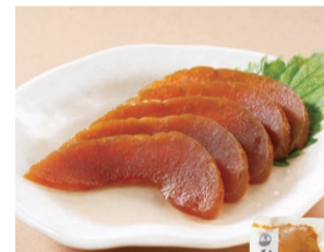
〈京つけもの大安〉 瓜奈良漬(小) (105g) ..... 810円