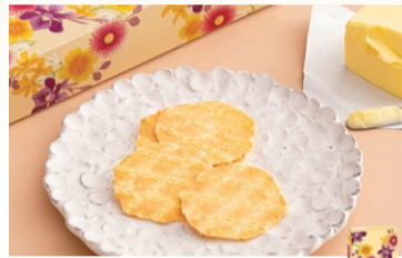
〈神戸風月堂〉レスポワール発酵バター (12枚(2枚入×6袋)) ..... 648円 (26枚(2枚入×13袋)) ..... 1,080円