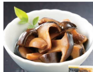
〈京つけもの大安〉 丹波大黒本しめじ (100g) ..... 648円