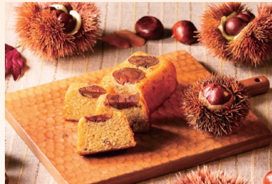
〈新宿高野〉 マロンケイク (1個) ..... 972円