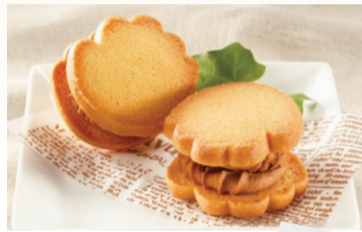
〈石村萬盛堂〉 祝うてサンド (4個) ..... 1,080円