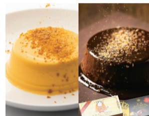
〈まえた〉(各2個入) カステラぷりん ..... 601円 カステラぷりん プレミアムショコラ ..... 651円