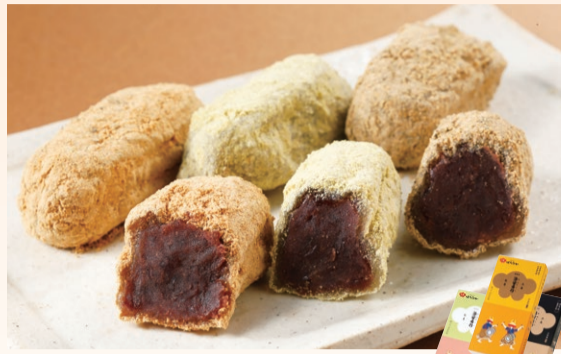
〈はたなか〉五島銘菓【治安孝行】(各4個) (治安孝行) ..... 601円 (治安孝行 うぐいすきな粉・治安孝行 黒胡麻黒豆きな粉) ..... 各681円