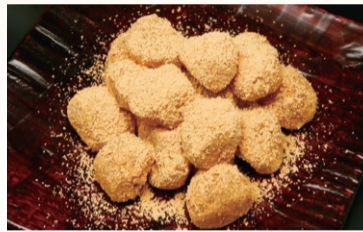
〈豆政〉 京のあもさん くり餅 (210g) ..... 918円