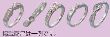
掲載商品は一例です。

豊富な種類の空枠の中から、お好みの デザインをお選びください。 カラーストーンの輝きを際立たせる デザイン枠もご用意いたしております。